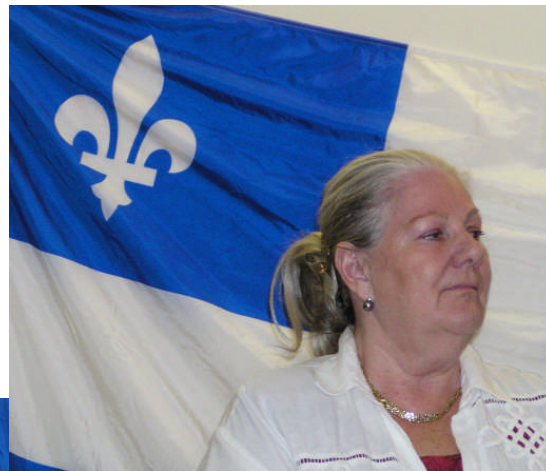
Charlotte L'Écuyer Députée du Pontiac à Québec